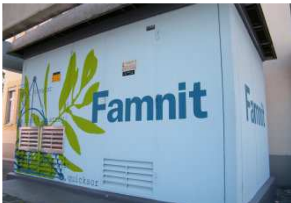
Slika x.yz. Naslov slike. (Times New Roman 10, št. slike v ležečem tisku)